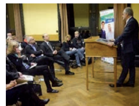
16. Unternehmens-Netzwerktreffen, Bückeburg, 22. November 2016

Dem „Überbetrieblichen Verbund Frau und Wirtschaft“ (ÜbV) gehören derzeit 52 Unternehmen aus dem Wirtschaftsraum Weserbergland an. Das gemeinsame Ziel ist die Gewinnung und Bindung von Fachkräften mit Familienaufgaben, der Erhalt und Ausbau deren Qualifikations- und Kompetenzpotenziale während und nach einer Familienphase sowie die Verbesserung der Vereinbarkeit von Beruf und Familie.